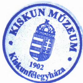
..... Fekete Beatrix múzeumpedagógus